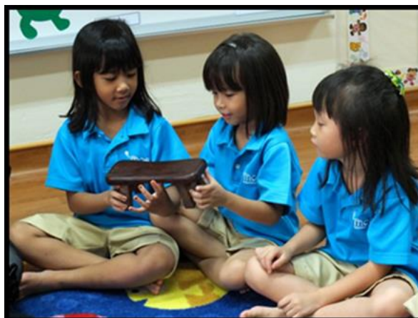
Kanak-kanak meneroka bantal kayu.

Kanak-kanak didedahkan kepada strategi yang dikenali sebagai ' Harvard Thinking Routine ' untuk pembelajaran dan menggunakan semua artifak yang terpilih dari muzium. Strategi ini dimulakan dengan melihat, berfikir dan bertanya soalan yang berkaitan tentang benda tersebut. Kanak-kanak digalakkan untuk berkongsi benda yang dilihat dan dipegang. Setelah itu, mereka harus fikirkan kegunaan dan cara benda tersebut digunakan. Akhir sekali, kanak-kanak akan bertanya tentang orang yang membuat barangan itu dan waktu benda itu digunakan.