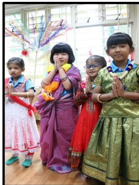
Kanak-kanak mencuba baju tradisional kaum India.