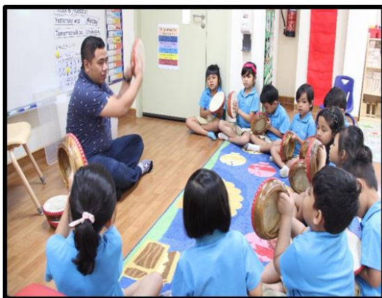
Seorang pakar berkongsi tentang kompang.

Pakar-pakar dalam masyarakat dijemput untuk berkongsi kepakaran mereka dengan kanak-kanak. Semasa menjalankan pembelajaran, guru dapat mengenali kanak-kanak dengan lebih rapat melalui interaksi dengan mereka, merekodkan pembelajaran dan memerhatikan kanak-kanak bermain dan meneroka artifak-artifak serta bahan-bahan yang disediakan.